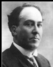
ANTONIO MACHADO (Sevilla, España, 1875 - Coillure, Francia, 1939)